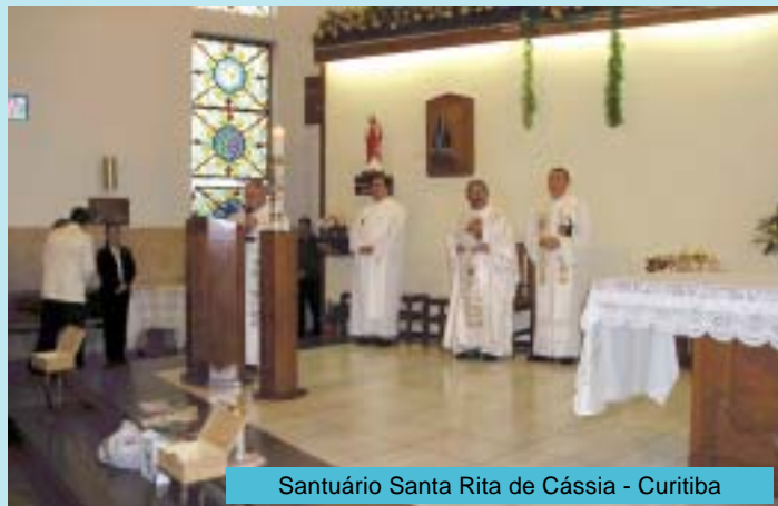
Santuário Santa Rita de Cássia - Curitiba