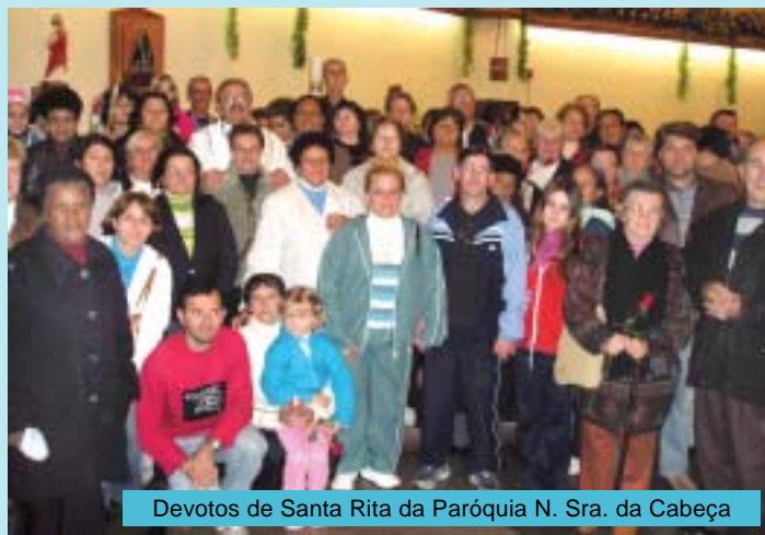
Devotos de Santa Rita da Paróquia N. Sra. da Cabeça